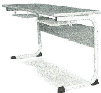
Stół komputerowy 2- osobowy z przystawką pod komputer na zewnątrz wolnostojąca

Wizualny wygląd mebli stanowiących przedmiot zamówienia