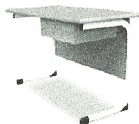
Bierko pod komputer