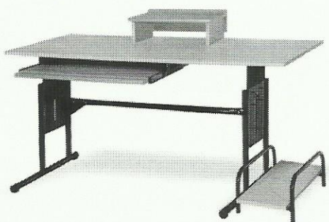
Stół komputerowy 2- osobowy

Wizualny wygląd mebli stanowiących przedmiot zamówienia